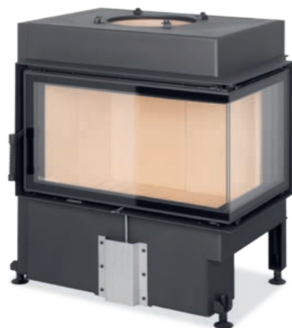
DYNAMIC R/L 3G 72.44.42.21 obj. kód: DR(L)3SH 21