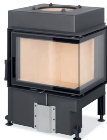
DYNAMIC R/L 3G 55.44.42.21 obj. kód: DR(L)3SG 21